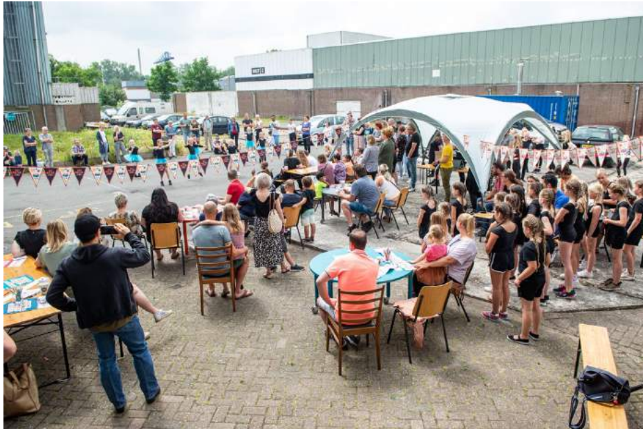
De open dag op 26 juni 2021