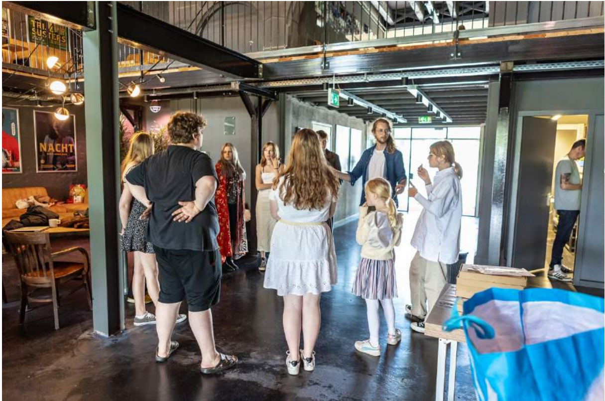
Aan het werk bij Tryater

Onder leiding van 2 theatermakers en regisseurs gingen de jongeren op onderzoek uit om een zintuigelijke theaterervaring voor publiek te ontwikkelen. De eerste weken kregen de jongeren diverse zintuigelijke ervaringen, zoals geblinddoekt eten, audiovisuele prikkelingen, communicatie door lichaamstaal, maar ook voelen en ruiken. Door het eerst zelf te ervaren en jezelf echt onder te dompelen in de mogelijkheden werden de jongeren gestimuleerd, gemotiveerd en geactiveerd om buiten eigen kaders te gaan denken.