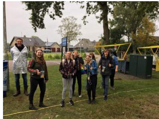
Werkbezoek voorstelling It gelok fan Fryslân

Ook zijn we wezen kijken bij de theatervoorstelling It gelok fan Fryslân van Tryater. Het interessante van deze voorstelling was dat het geen traditionele theatervoorstelling was. De voorstelling beleefde je individueel en met een koptelefoon op volgde je een geel touw dat door een dorp in Fryslân liep (zo'n 4 tot 5 km lang). De audio die je hoorde vertelde allemaal verhalen van bewoners uit dat dorp.