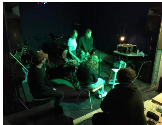
Zelf muziek maken

Onder leiding van 2 kunstenaars/begeleiders gingen de 9 jongeren op ontdekkingstocht. De groep tweedejaars ging met een theatermusicus aan de slag met het bouwen van eigen muziekinstrumenten en met het creëren van niet-alledaagse geluiden. Deze instrumenten en geluiden werden gebruikt in verschillende composities die uiteindelijk in een eindfilm als underscore diende.