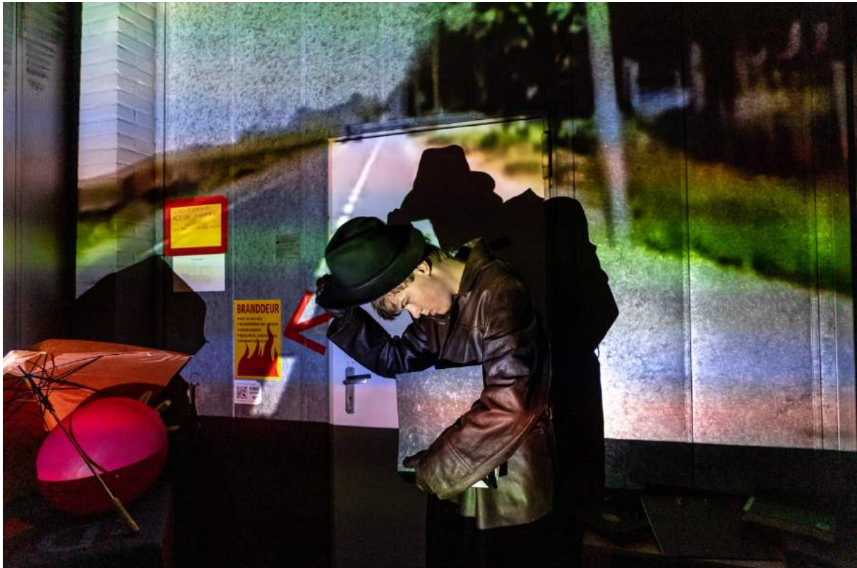
In rol voor de performance