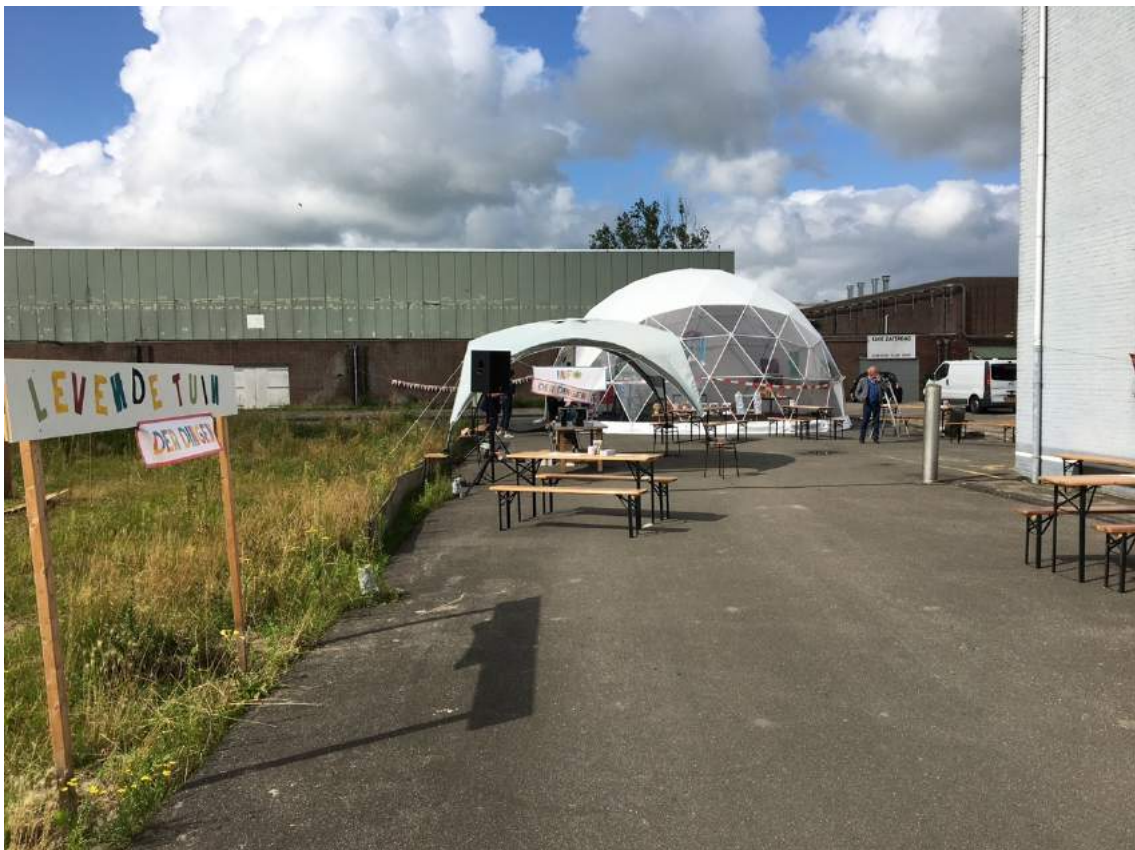
Het museum vlak voor de opening op 28 augustus