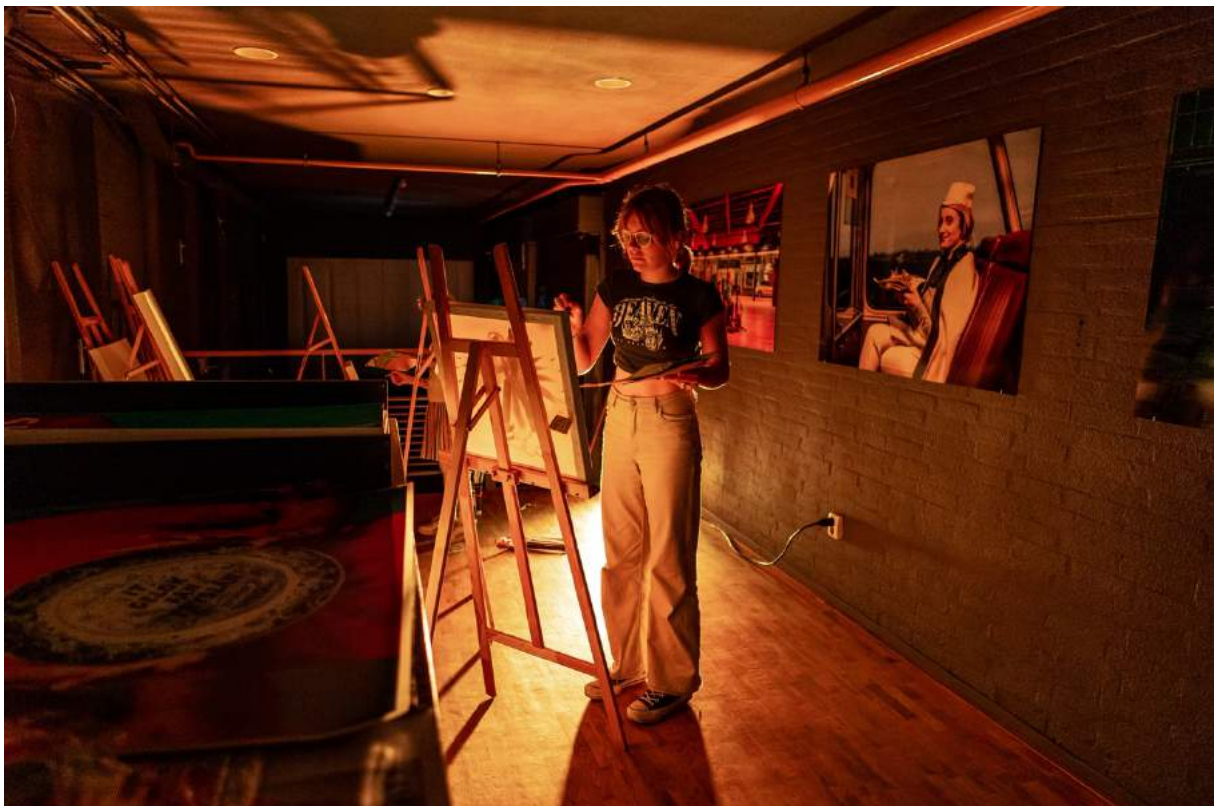
In rol voor de performance