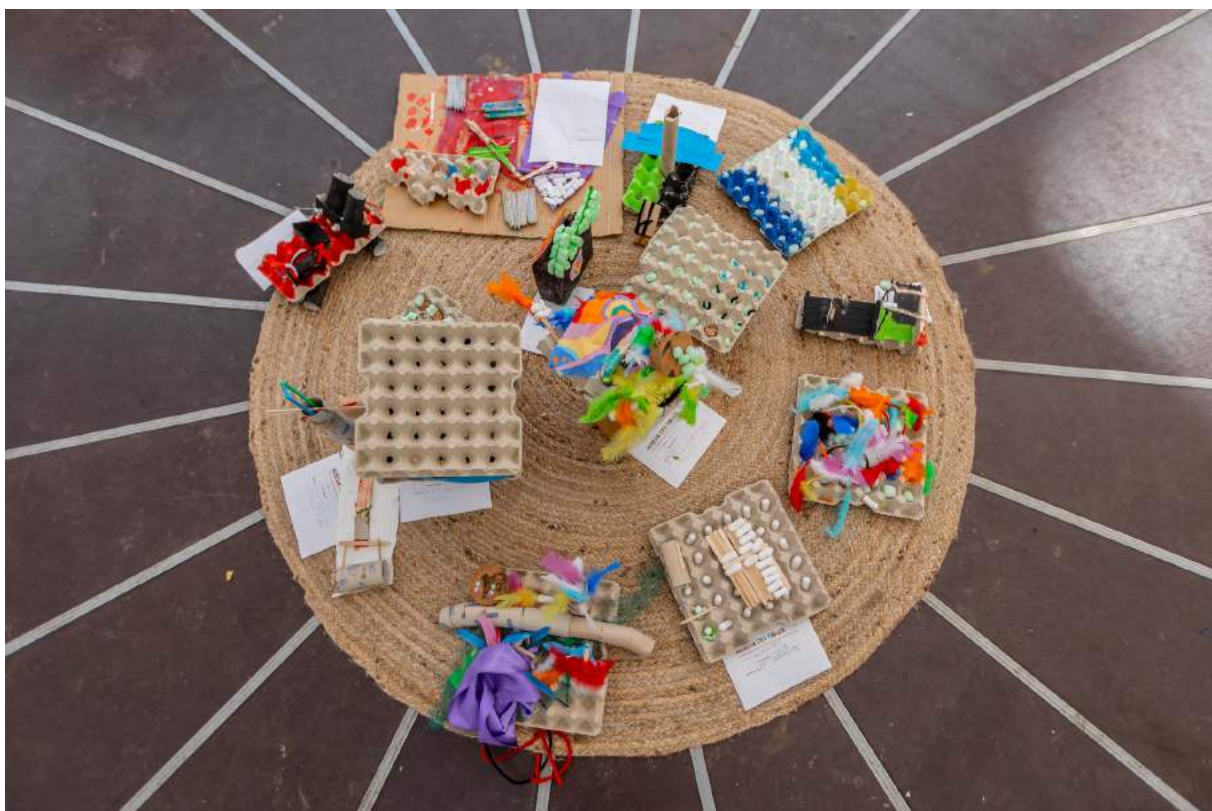
Kunst in het museum

Op 28 augustus 2021 werd het tijdelijke Museum der Dingen feestelijk geopend door een van de kinderkunstenaars en de wethouder van de gemeente Tytsjerksteradiel. Het museum stond vol kunstwerken van kinderen. De opening van het museum viel samen met de open dag van Het Achterland. Tijdens die dag konden kinderen en jongeren diverse workshops volgen, zoals graffiti, theater, kostuums en beeldend. Hieronder een aantal foto's ter illustratie: