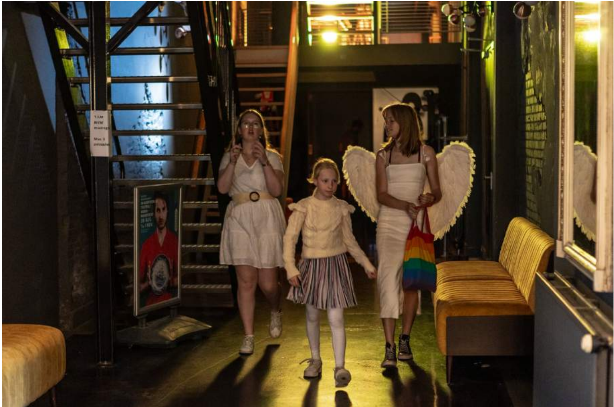
In rol voor de performance