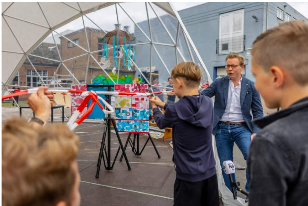
Opening Museum der dingen